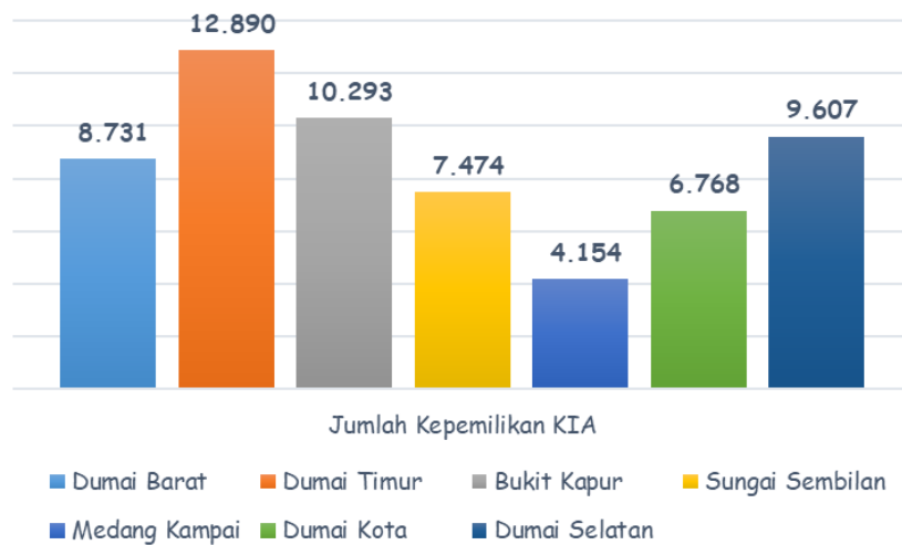
Gambar 1. 1 Jumlah Anak Usia 0 – 17 Tahun yang Memiliki Kartu Identitas Anak (KIA) berdasarkan Kecamatan Tahun 2024